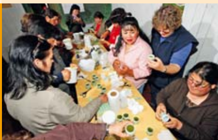
WGT-Projekt in Chile: Heilkräuter statt teurer Medizin

Das Deutsche WGT-Komitee e.V. unterstützt Frauenprojekte auf der ganzen Welt. Der Großteil der Kollekte der WGT-Gottesdienste wird dafür eingesetzt. Ein Teil der geförderten Projekte stammt aus dem Bereich „Ernährungssicherheit“. Partnerorganisationen in Asien, Afrika und Lateinamerika fördern hier Kleinbäuerinnen. Die Frauen erhalten z.B. Kleinkredite, um ökologisch Lebensmittel zu produzieren. Mit dem erwirtschafteten Geld können sie zum einen ihre Familien ernähren, zum anderen werden durch agroökologischen Landbau auch Boden, Wasser und Artenvielfalt geschützt. Außerdem werden die Frauen z. B. in Weiterbildungen darin bestärkt, sich zu organisieren und ihre Land- und Besitzrechte einzufordern.